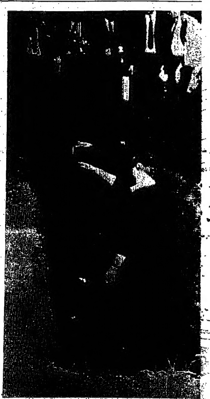
المكثور (أولاد برون) في حفل افتتاح أولمبيوس في ولاية أركنيس بأمريكا. يتكف من أحد القبول الأثلاث في بطولة للمسن التي مثل أن السيطر ككسوا بكتلون وينفون بها سرا. وقد تسال برون انه يعتقد ان ما يقارب ثلثه من جنة حفت في هذه القبول خلال المسنة الماضية

تعاون الأزمات السياسية والبراسمالية وقال المستر تالوز وهو وزير الزراعة والمعلم ان القوائد الرئيسية من جولة كيني انحصرت على الدول النامية ضامنا على حساب البلدان الزراعية.